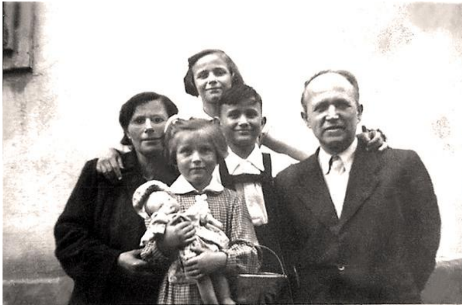
(1954 családi fénykép)

Édesanyánk könnyebben megúszta. Ellentétben a tudósításokban megjelentekről, nem tört el egyetlen végtagja sem, de zúzódásos sérüléseket szenvedett, a kórházi ellátás után távozott is a kórházból. Ő nem dolgozott, nem volt alkalmazott, édesapánknak segített, gyereket nevelt és a háztartást vezette.