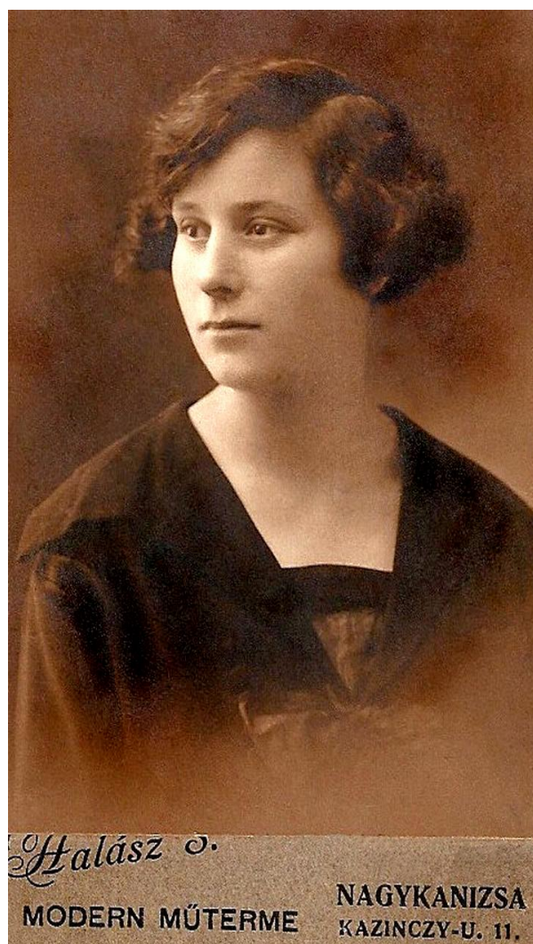
(1937 Anna, A fiatal Feleség)

Édesanyánkról még elmondanám, hogy többször járt "frontközelen". 1944 év végén amikor édesapánkat behívták frontszolgálatra, édesanyánk aggódott és folyamatosan próbált nyomában járni. Több alkalommal követte, egészen a tűzvonal közelében is, említette, hogy éjszaka is ment, maga sem tudta, hogy merre. Hajmáskér, Várpalota környékén, ott ahol a madár sem járt, fenn a magasban (drótkötél pályán) a szénszállító csillék jártak, a látóhatár szélén pedig nagy villanások, dőrejek. Vitt magával élelmiszert, cserekereskedéshez dohányárút, és mindazt, amit gondolta, hogy édesapánknak szüksége lehet. Többször feltartóztatták, visszaküldték, megfenyegették. Hírt többször kapott róla, találkozni nem sikerült édesapánkkal. Volt, hogy az összekészített csomagot a hátvonalban pihenőn lévő katonatársaknak adta, kérve őket, hogy adják át édesapánknak. Keresztanyám – akinek a férje édesapánkkal együtt volt katona – azt mondta, hogy vakmerő volt édesanyánk és nem lehetett lebeszélni a kalandos utakról.